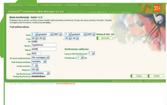
Rysunek 2. Contactis Conference – Kreator tworzenia konferencji